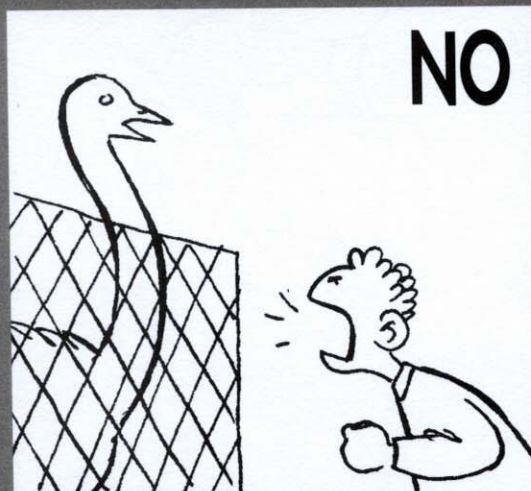
Gritarles y hacer ruido