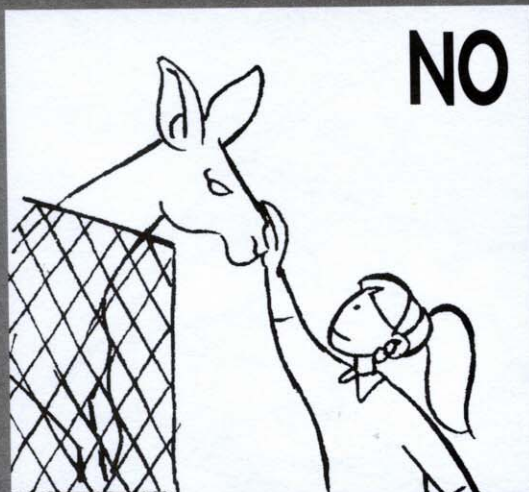
Tocar los animales