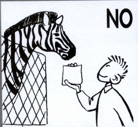
Dar de comer a los animales