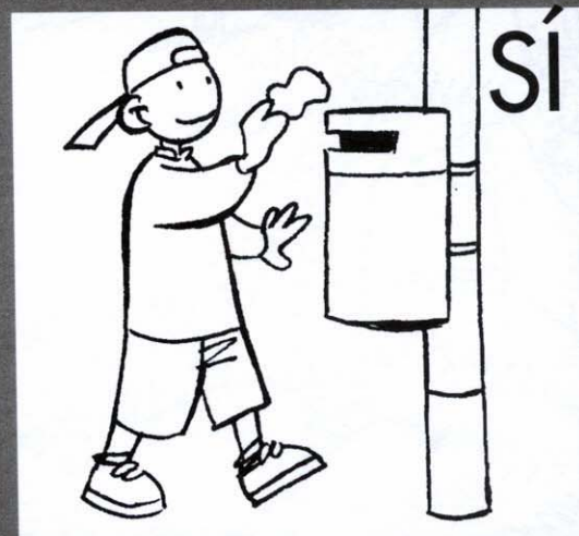
Usar las papeleras