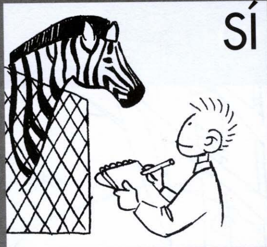
Observar y tomar notas o dibujar