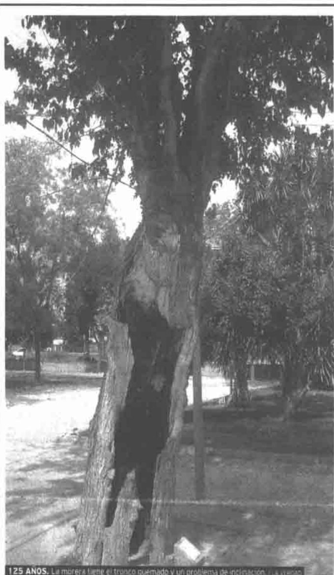
125 AÑOS. La morera tiene el tronco quemado y un problema de inclinación. EL PASADO

La morera más antigua está en El Malecón